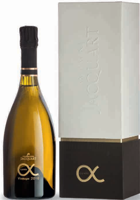
57045 CUVÉE ALPHA MILLÉSIMÉ 2010 IN COFANETTO