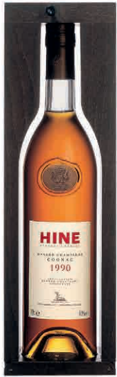
35658 GRANDE CHAMPAGNE VINTAGE 1990 IN CASSETTA LEGNO