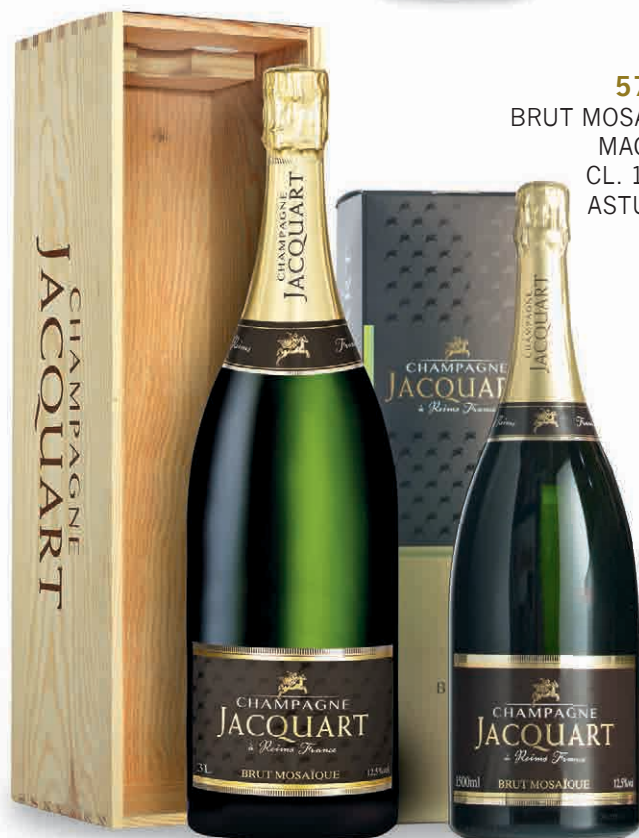
57036 BRUT MOSAÏQUE MAGNUM CL. 150 IN ASTUCCIO