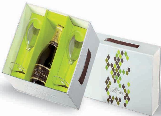
94867 COFANETTO 1 BRUT MOSAÏQUE E 2 FLUTES JACQUART