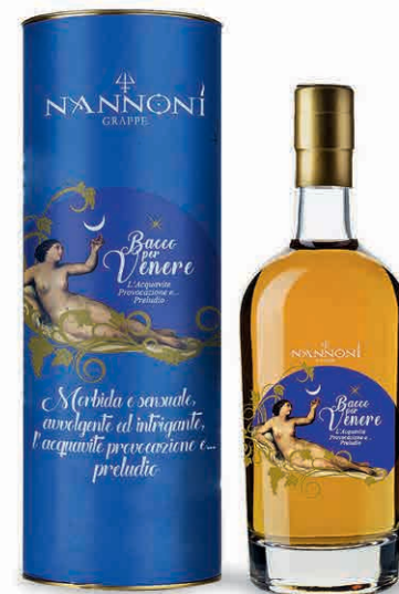
20867 NANNONI RISERVA BACCO PER VENERE IN ASTUCCIO