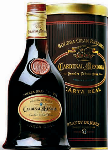
31470 CARTA REAL SOLERA GRAN RISERVA