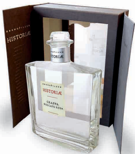
15170 HISTORIAE MOSCATO ROSA COFANETTO LUXURY