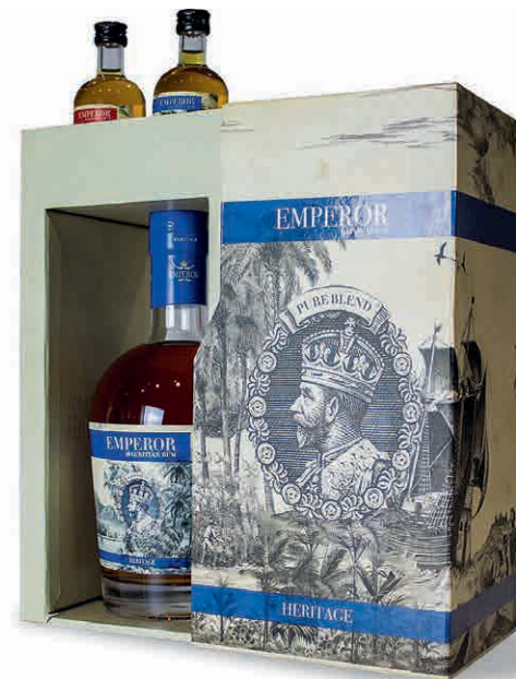
97856 EMPEROR HERITAGE + 2 BT 5 CL E.R. HERITAGE E 5 CL E.R. SHERRY CASK (ORIG. MAURITIUS)