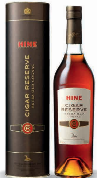
35648 CIGAR RESERVE