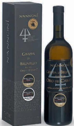
20857 NANNONI RISERVA ORO DEI CARATI IN ASTUCCIO