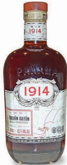
33097 1914 PANAMA IN ASTUCCIO (ORIG. PANAMA)