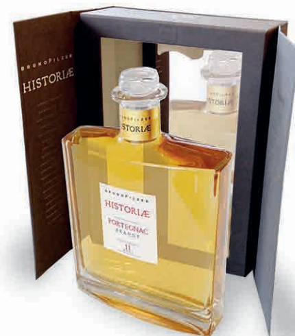
15172 BRANDY PORTEGNAC 11 ANNI COFANETTO LUXURY