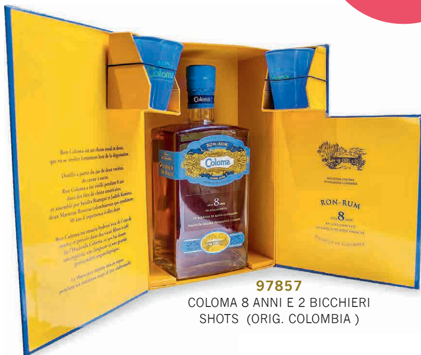
97857 COLOMA 8 ANNI E 2 BICCHIERI SHOTS (ORIG. COLOMBIA)