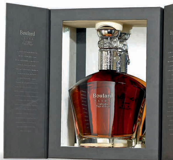
38043 DECANTER EXTRA