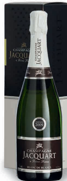
57040 BLANC DE BLANCS MILLESIMÉ 2009 IN ASTUCCIO