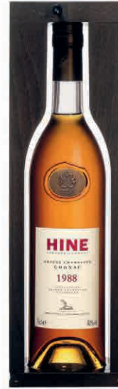
35654 GRANDE CHAMPAGNE VINTAGE 1988 IN CASSETTA LEGNO