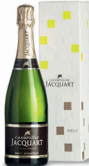
57033 BRUT MOSAÏQUE IN ASTUCCIO