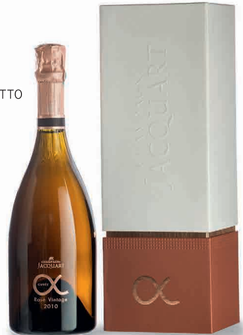
57056 CUVÉE ALPHA ROSÈ MILLÉSIMÉ 2010 IN COFANETTO