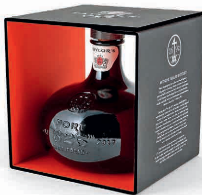
42942 RESERVE TAWNY 325° ANNIVERSARIO IN ASTUCCIO