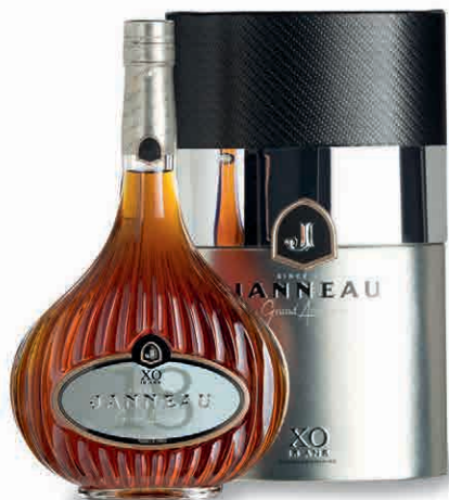
31247 XO 18 YO 31244 XO ROYAL 31241 GRAND ARMAGNAC NAPOLEON 31347 VSOP