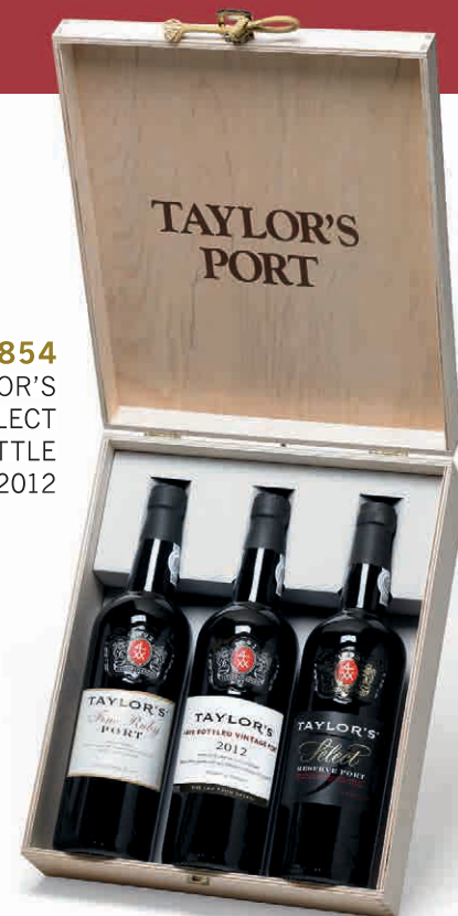
97854 PORTO TAYLOR'S FINE RUBY - SELECT - LATE BOTTLE VINTAGE 2012