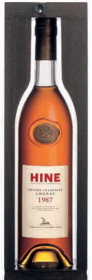
35652 GRANDE CHAMPAGNE VINTAGE 1987 IN CASSETTA LEGNO