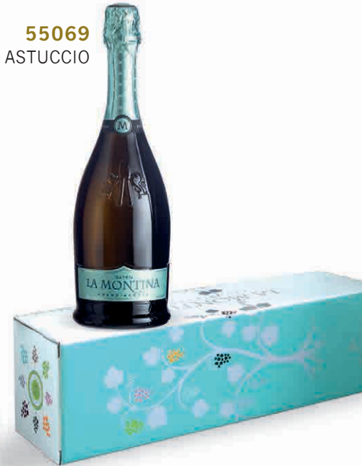
55069 BRUT SATÉN IN ASTUCCIO