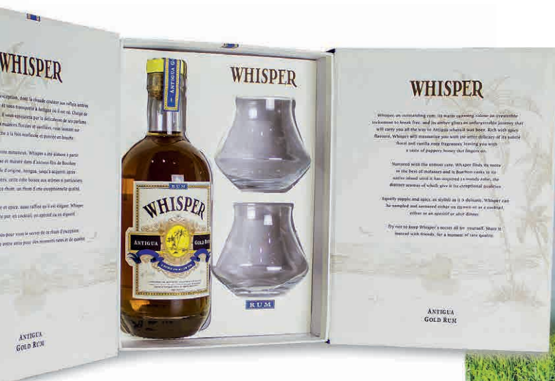
97859 WHISPER 12 ANNI E 2 BICCHIERI WARM (ORIG. ANTIGUA)