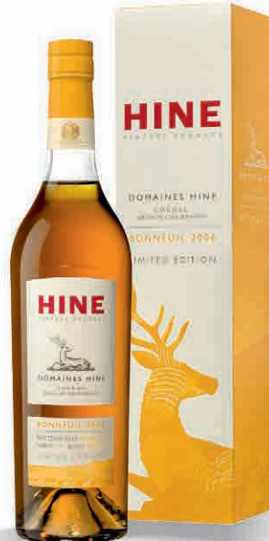
35644 DOMAINES BONNEUIL 2006