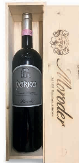
97852 MORODER: DORICO ROSSO CONERO RISERVA D.O.C.G.