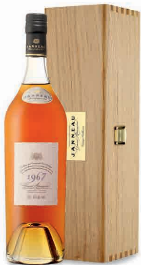
31370 MILLESIME 1967