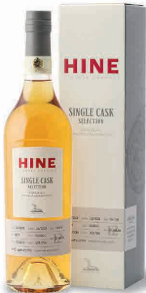
35646 SINGLE CASK SEGONZAC 2004