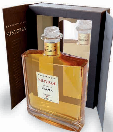
15171 HISTORIAE MILLESIMATA 2009 COFANETTO LUXURY