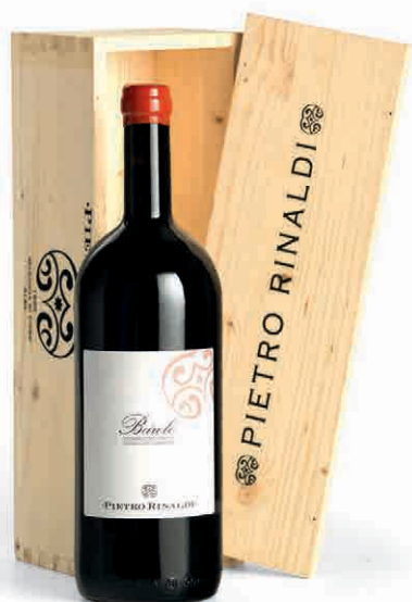
95865 CANTINA PIETRO RINALDI: BAROLO D.O.C.G. MONVIGLIERO