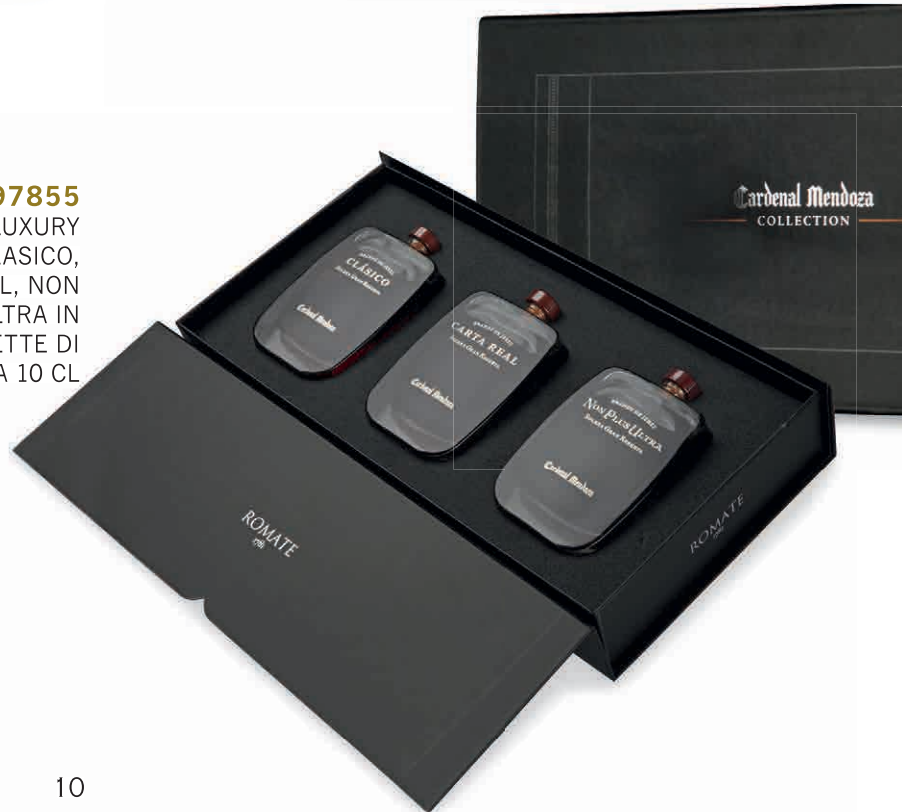
97855 CONFEZIONE LUXURY TASTING: CLASICO, CARTA REAL, NON PLUS ULTRA IN FIASCHETTE DI CRISTALLO DA 10 CL