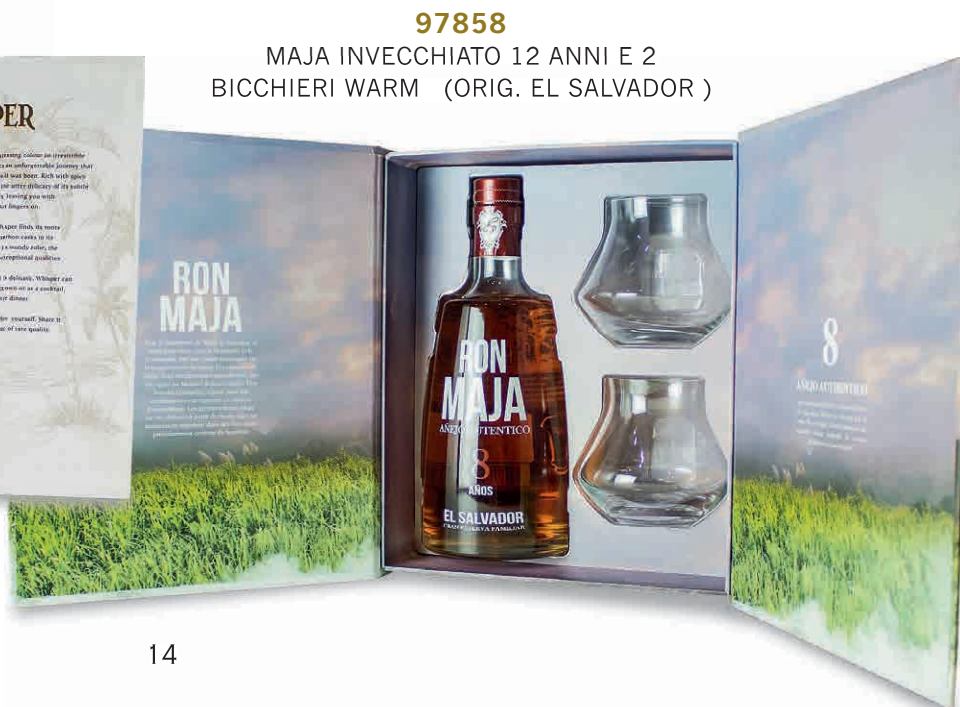
97858 MAJA INVECCHIATO 12 ANNI E 2 BICCHIERI WARM (ORIG. EL SALVADOR)