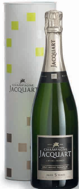
57055 BRUT MOSAÏQUE SIGNATURE IN ASTUCCIO