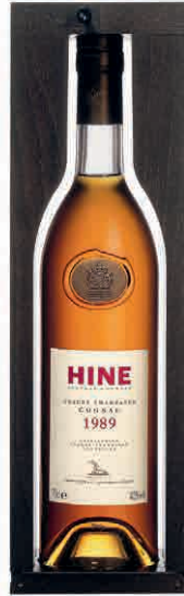
35656 GRANDE CHAMPAGNE VINTAGE 1989 IN CASSETTA LEGNO