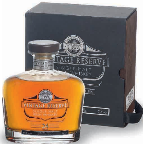
26904 TEELING VINTAGE RESERVE 24 YO SINGLE MALT IN COFANETTO