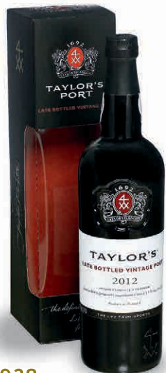
42938 LATE BOTTLE VINTAGE 2012