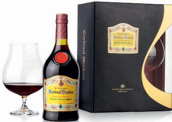
31612 SOLERA GRAN RISERVA E BICCHIERE DA MEDITAZIONE