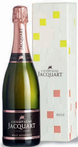
57034 ROSÉ MOSAÏQUE IN ASTUCCIO