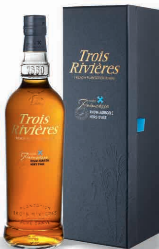
30009 CUVÉE PRINCESSE ASSEMBLAGGIO DI 50 CUVÈE DI CUI 8 MILLESIMI A.O.C. IN ASTUCCIO