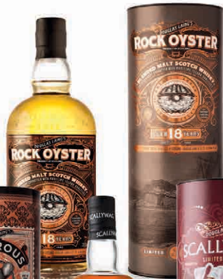
26977 ROCK OYSTER 18 YO IN ASTUCCIO