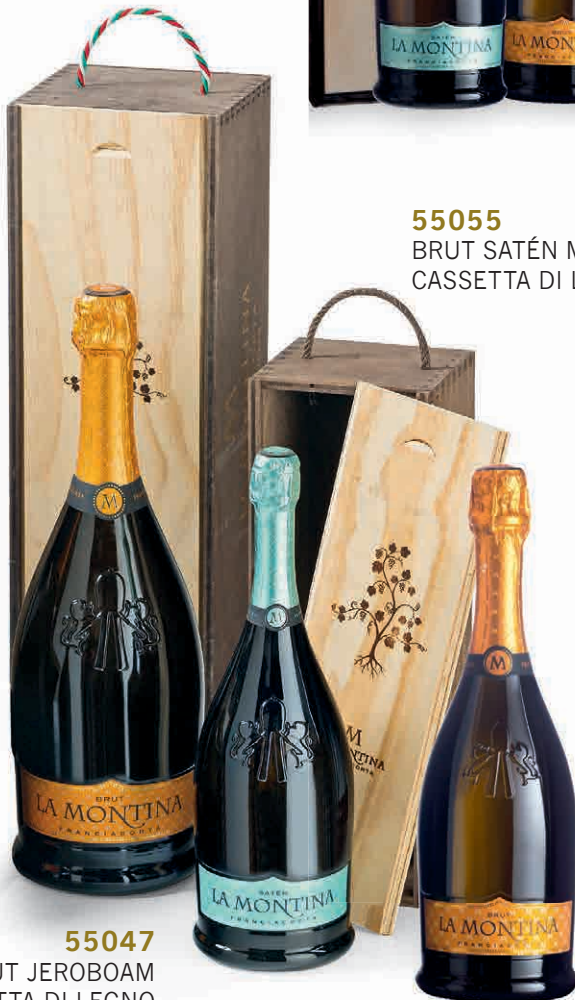
55047 BRUT JEROBOAM IN CASSETTA DI LEGNO