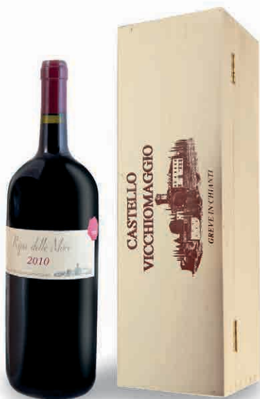
95863 CASTELLO VICCHOMAGGIO: RIPA DELLE MORE