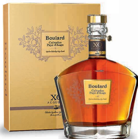
38044 DECANTER XO AUGUST