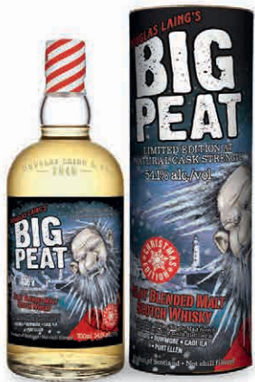
26877 BIG PEAT CHRISTMAS LIMITED EDITION IN ASTUCCIO