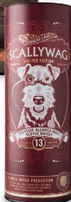
26973 SCALLYWAG 13 YO IN ASTUCCIO