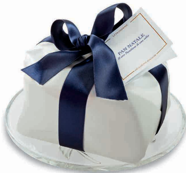
97862 PAN NATALE KG. 1 IL VERO PANETTONE BASSO SECONDO LE PIÙ ANTICHE E NOBILI TRADIZIONI. SPECIALITÀ ARTIGIANALE