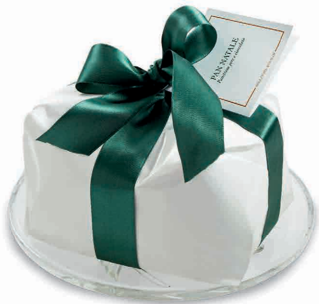
97864 PANETTONE PERE E CIOCCOLATO FONDENTE KG. 1 PANETTONE BASSO CON PEZZI DI PERA SEMICANDITA E GOCCE DI CIOCCOLATO FONDENTE. SPECIALITÀ ARTIGIANALE