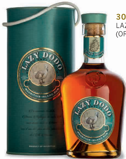
30601 LAZY DODO IN ASTUCCIO (ORIG. MAURITIUS)