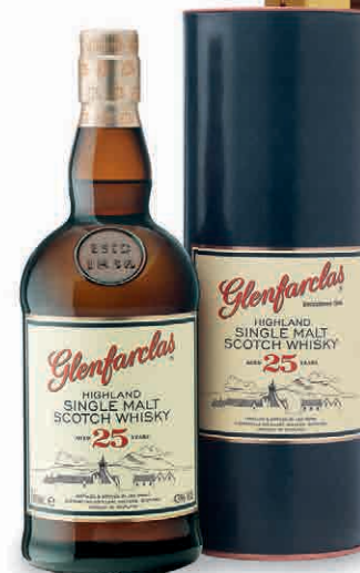
22207 GLENFARCLAS 25 YO