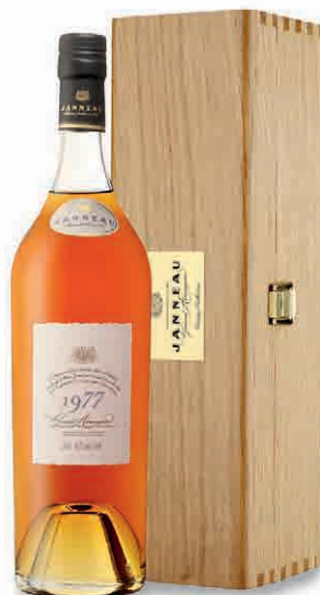
31249 MILLESIME 1977