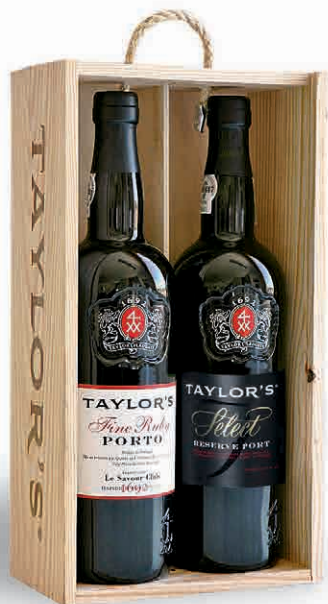
97853 PORTO TAYLOR'S FINE RUBY - SELECT