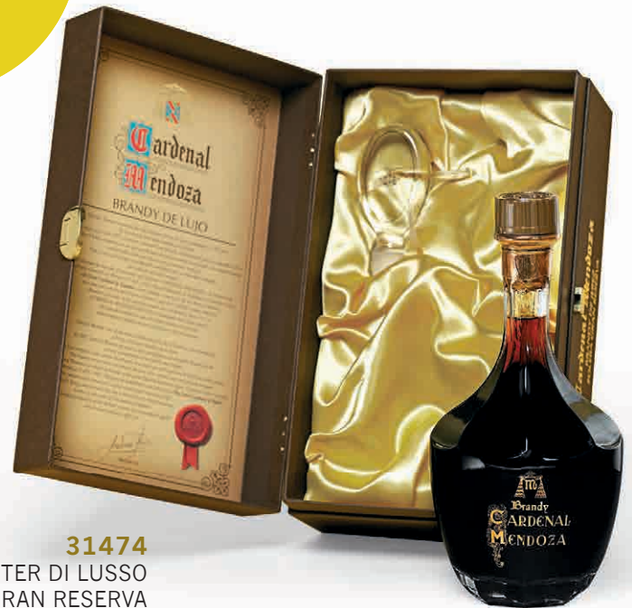
31474 DECANTER DI LUSO SOLERA GRAN RISERVA