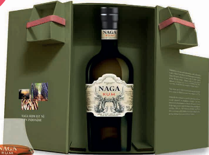
97860 ELEGANTE CONFEZIONE REGALO CON 1 BT NAGA E 2 BICCHIERI DA DEGUSTAZIONE (ORIG. INDONESIA )