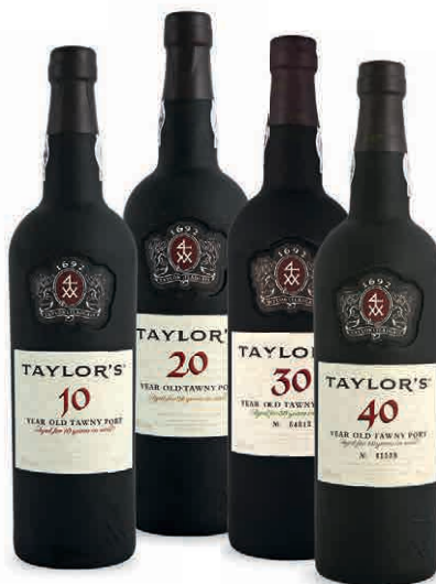
42836 TAYLOR'S 10 ANNI 42837 TAYLOR'S 20 ANNI 42839 TAYLOR'S 30 ANNI 42838 TAYLOR'S 40 ANNI TUTTI IN ASTUCCIO