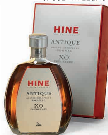
35632 ANTIQUE XO 1 ER CRU