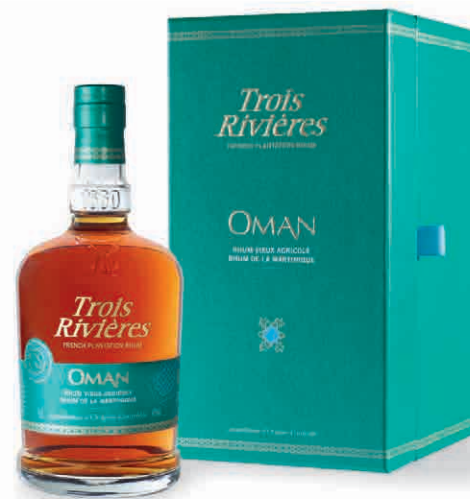
30005 CUVÈE OMAN ASSEMBLAGGIO DI 12 MILLESIMI A.O.C. IN COFANETTO