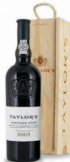
42940 TAYLOR'S VINTAGE 2003 CLASSIC PORT 42934 TAYLOR'S VINTAGE 2009 CLASSIC PORT