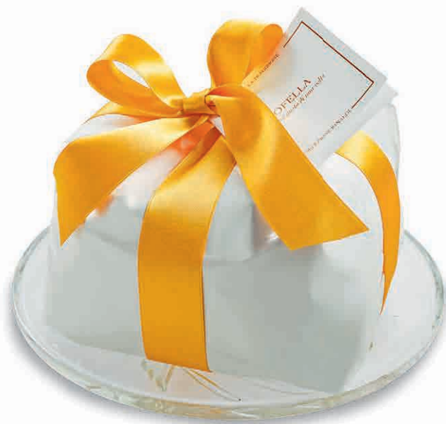
97863 OFELLA KG. 1 IL VERO PAN D'ORO DI UNA VOLTA, SPECIALITÀ ARTIGIANALE CON INGREDIENTI NATURALI SCELTI CON CURA. SPECIALITÀ ARTIGIANALE