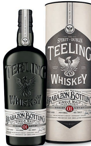
26910 TEELING BRABAZON IN ASTUCCIO