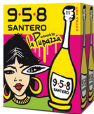
Cartone da 6 bottiglie 750ml 6 bottles case 750ml