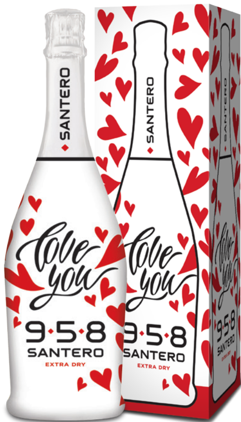
750ml + Astuccio