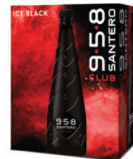
Cartone da 6 bottiglie 750ml 6 bottles case 750ml