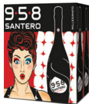
Cartone da 6 bottiglie 750ml 6 bottles case 750ml

958 Santero Millesimato is the essence of the best bubbles signed 958 Santero. Only during favorable vintages the grapes are strictly selected and processed through a special wine making, which follows both ancient techniques and new technologies. This is how the 958 Santero Millesimato was born. With its fine and persistent perlage, well-structured bouquet and fresh taste, 958 Santero Millesimato gives unique and special vibes.