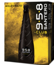
Cartone da 6 bottiglie 750ml 6 bottles case 750ml