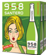
Cartone da 6 bottiglie 750ml 6 bottles case 750ml

Alcohol Free, sweet and with the exotic taste of tropical fruits the 958 Santero no Alcohol is perfect at any time of the day and for any occasion. 958 Santero Alcohol Free gives you the green light to drink while preserving your concentration, your driving skills and your safety at work, with your family and friends.