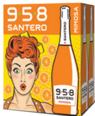
Cartone da 6 bottiglie 750ml 6 bottles case 750ml

Orange is the fruit of sun, reminiscent of summer and its scents. The 958 Santero Mimosa made this fruit its symbol. Sweet but strong taste, with pleasantly sour tones, its bubbles enliven a fine and persistent perlage for a fresh, young and new way of drinking.