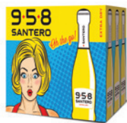
Cartone da 12 bottiglie 200ml 12 bottles case 200ml

The sexy bubbles in your pocket! The 958 Santero Extra Dry "baby" bottle version is handy and versatile. A real treat that will allow you to enjoy the fresh 958 Santero bubbles wherever you are.