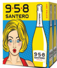
Cartone da 6 bottiglie 750ml 6 bottles case 750ml