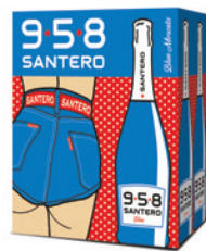
Cartone da 6 bottiglie 750ml 6 bottles case 750ml