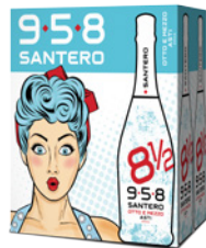
Cartone da 6 bottiglie 750ml 6 bottles case 750ml

958 Santero launches on the market the new product Asti 8½ DOCG which completes and enriches the Asti range. It is a new sparkling wine, 100 % white Moscato grape with a unique fresh bouquet and a pleasant sweet taste, ideal for every occasion as aperitif or on the rocks.