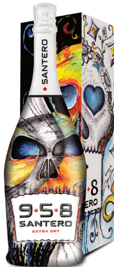
Magnum 1,5l + box