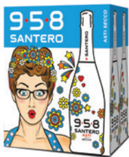
Cartone da 6 bottiglie 750ml 6 bottles case 750ml

Asti Secco D.O.C.G. 958 Santero is the new trend of the year. Asti is generally known as a sweet sparkling wine with the denomination D.O.C.G., obtained by 100% Moscato grapes. Asti Secco 958 Santero respects the traditional Winemaking knowledge of the area between Langhe and Monferrato, not by chance declared a UNESCO World Heritage Site. Even though the sweetness is lower than the traditional Asti D.O.C.G., it keeps the fragrance and the aromatic bouquet of Moscato grapes.