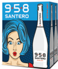
Cartone da 6 bottiglie 750ml 6 bottles case 750ml

The sparkling sexy bubbles contained in a bottle with a unique and inimitable style. 958 Santero Classic is the final result of years of research, created for surprising the most refined palates. Perfect for all convivial moments, such as aperitifs, lunches and dinners.