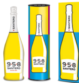
Disponibile anche con tubo in metallo o astuccio in cartone Available in metal box or cardboard box

A renovated art and a language never used before transforming the grape juice to sparkling bubbles, the most fashionable and desired ones. 958 Santero is all of that, a wave of sparkling sexy bubbles reaching your heart through taste.