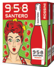
Cartone da 6 bottiglie 750ml 6 bottles case 750ml

The queen of wild berries, the red strawberry, main ingredient of 958 Santero Rossini, a mix of aromas and flavors reminiscent of this red fruit, enhanced by the bubbles that makes it suitable for any occasion, such as a nice walk in the countryside in Autumn.