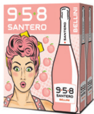
Cartone da 6 bottiglie 750ml 6 bottles case 750ml

The pink of peach blossoms, the fragrance of the fruit and the elegance of a unique cocktail with low alcohol content. 958 Santero Bellini is the new drinking style that combines the delicacy of the peach with the freshness of the bubbles. A unique experience, ideal for all occasions and exciting like Spring.