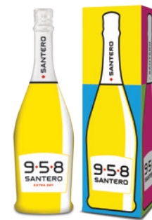
Astuccio Magnum da 1 bottiglia 1,5l 6 bottles case 1,5l

958 Santero in Magnum bottle (1,5l) versions exalts the perspective of the fashionable bubbles. With its captivating image and always in its box, it is certainly a must not to be missed.