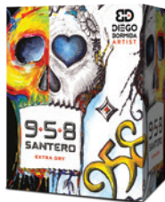
Cartone da 6 bottiglie 750 ml 6 bottles case 750 ml