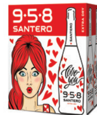
Cartone da 6 bottiglie 750ml 6 bottles case 750ml

958 Santero "Love" a special bottle for a special person, not only on Valentine's Day but for each day of the year. 958 Santero Love Bottle is the ideal gift, the charming look, the toast with two glasses of bubbly, the sexy bubbles.