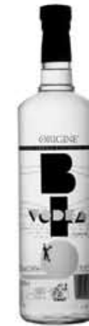
Bio Vodka - 37,5% vol. 100 cl