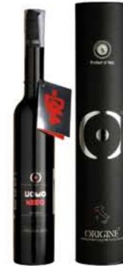
Liquore Nocino - 37,5% vol. 50 cl