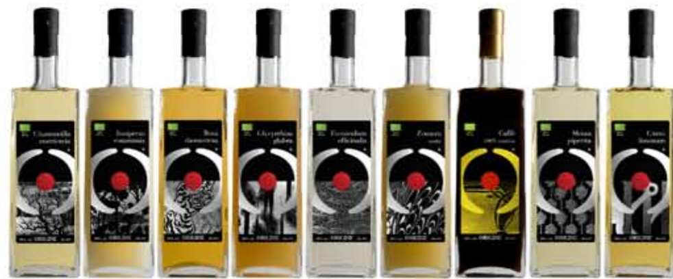
Linea Monoerbe - 30% vol. 50 cl