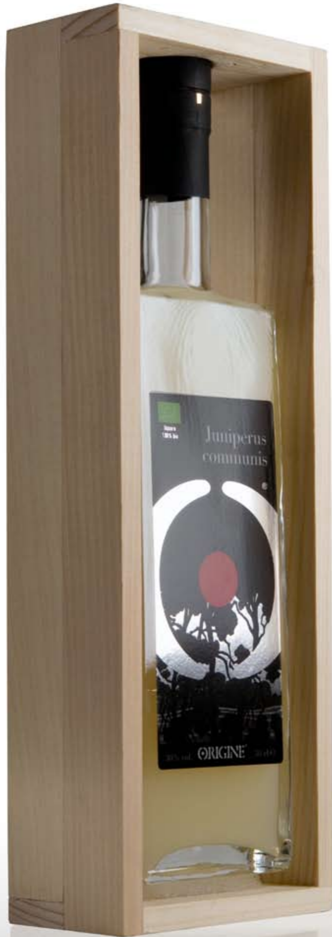
wood's packaging © 2018 Danilo Assandri